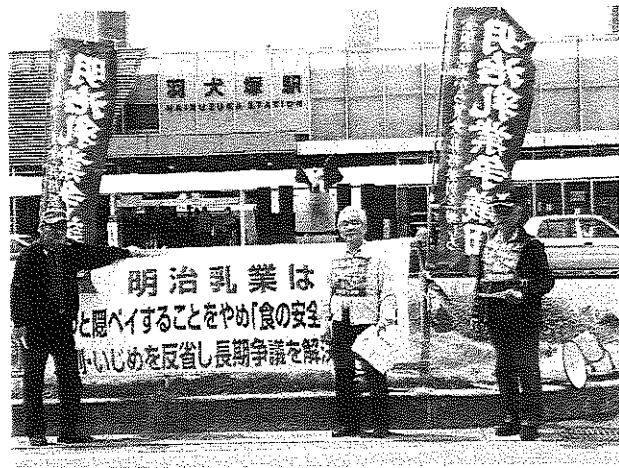
福岡県、明治八女工場通勤羽犬塚駅で宣伝行動。この後、周辺へチラシのポスティングを行いました。