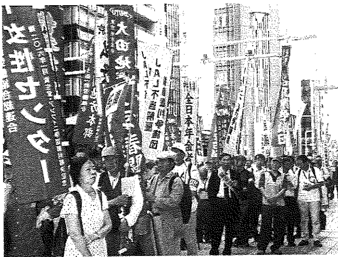
全労連・東京地評争議支援総行動(5月30日)、(株)明治本社に236名が結集。中労委命令を受入れ直ちに争議解決を求める！