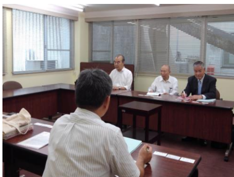
38市町村で自治体職員と懇談

今年のキャラバンでは①行政運営に必要な体制の整備（人員の確保）②非正規職員の労働条件と最低賃金③税金の適正執行に係る公契約適正化対策等を主なテーマとして懇談しました。