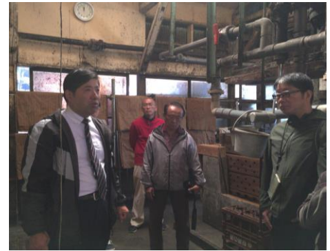
歴史ある醤油の蔵で説明を聞く

参加者から「醤油日本一の千葉県の大手企業と中小企業の醤油について知った。歴史と国策の関連性を学べて良かった」などの声が寄せられました。