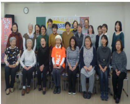
笑いヨガの後、みんなでパチリ

11月17日に自治体福祉センターで『輝く女性の千葉県集会』と千葉労連女性の会総会が24人の参加で行われました。