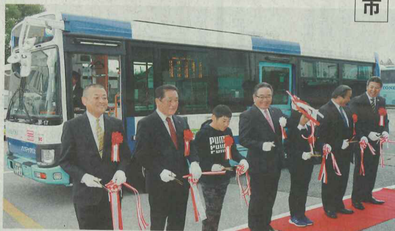
テープカットして運行開始を祝う関係者ら＝横芝光町役場で