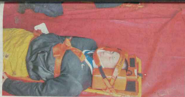
現場に設営されたエアテント内では、救急救命士とDMATが重傷者の処置に当たる訓練が行われた。船橋市で

生とともに消防車両九台とDMATの一台が駆け付け、消防署員ら計百五人が参加した。救急救命士の署員は二段階のトリアージを行うとともに、現場には応急救護所となるエアテント二棟を設営。ストレッチャーで運んだ人が重傷、中等傷、軽傷に分け、重傷者のテント内ではDMATの医師と看護師らが救命治療を施した。