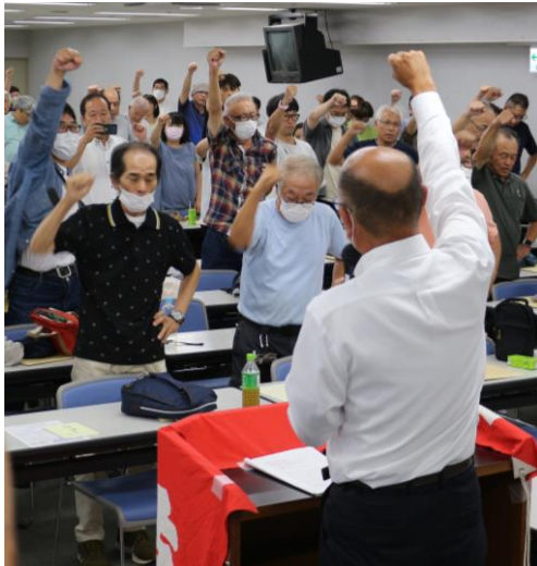
団結してガンバロウと組合員の意思統一